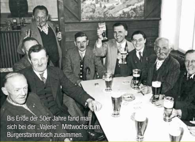
Bis Ende der 50er Jahre fand man sich bei der „Valerie“ Mittwochs zum Bürgerstammtisch zusammen.