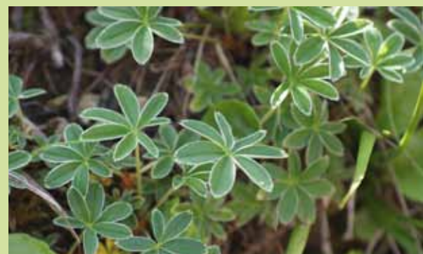
Silbermantel: wächst im Gebirge und hat noch intensivere Heilwirkung. Typisch ist die silberfärbige Blattbordüre und die Blätter sind härter