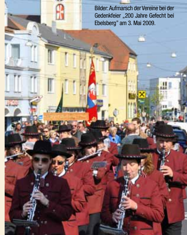
Bilder: Aufmarsch der Vereine bei der Gedenkfeier „200 Jahre Gefecht bei Ebelsberg“ am 3. Mai 2009.