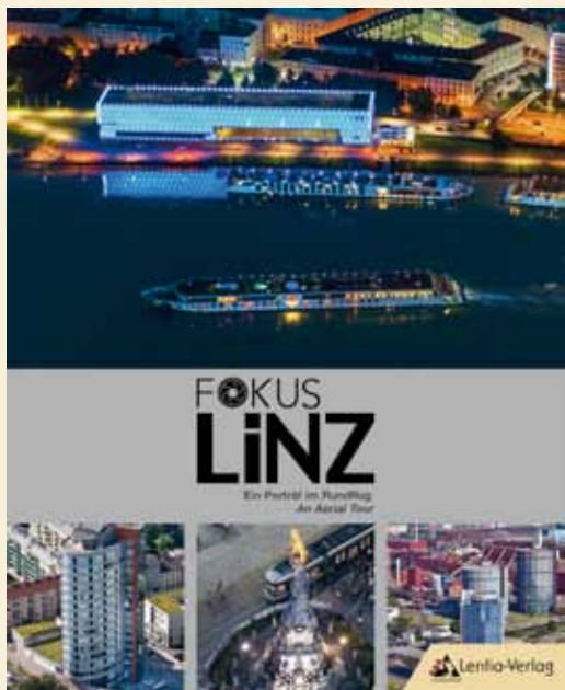
Fokus Linz Ein Porträt im Rundflug / An Aerial Tour 200 Seiten, 24 x 30 cm ..... € 29,90

Lassen Sie sich ein auf die Vergangenheit der Stadt mit ihren Höhen und Tiefen. Bildgewaltig dokumentiert und kompetent erläutert ist die Reihe „LINZ-Zeitgeschichte“ eine unvergleichliche Sammlung wertvoller Aufnahmen, die gleichsam wichtige Zeitzeugen verschiedener Abschnitte der jüngeren Linzer Geschichte sind. Mit dieser Buchreihe hauchen wir der Geschichte Leben ein.