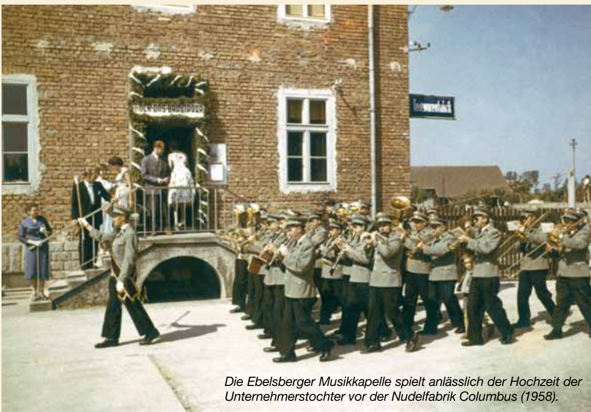
Die Ebelsberger Musikkapelle spielt anlässlich der Hochzeit der Unternehmerstochter vor der Nudelfabrik Columbus (1958).