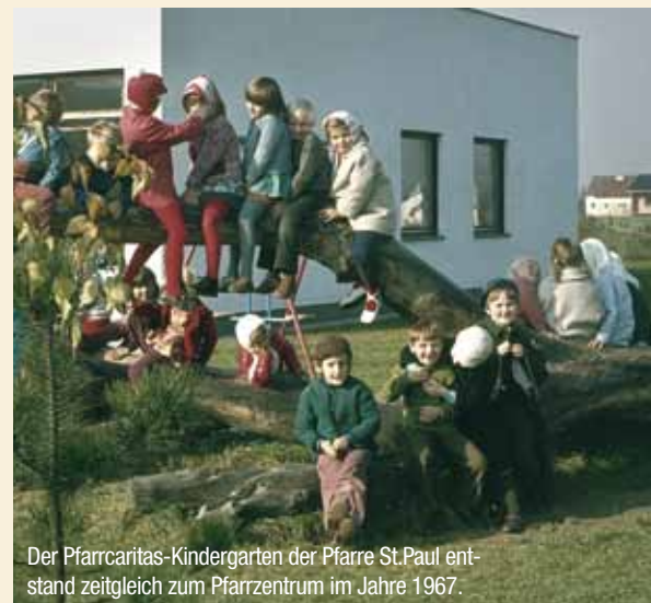
Der Pfarrcaritas-Kindergarten der Pfarre St.Paul entstand zeitgleich zum Pfarrzentrum im Jahre 1967.