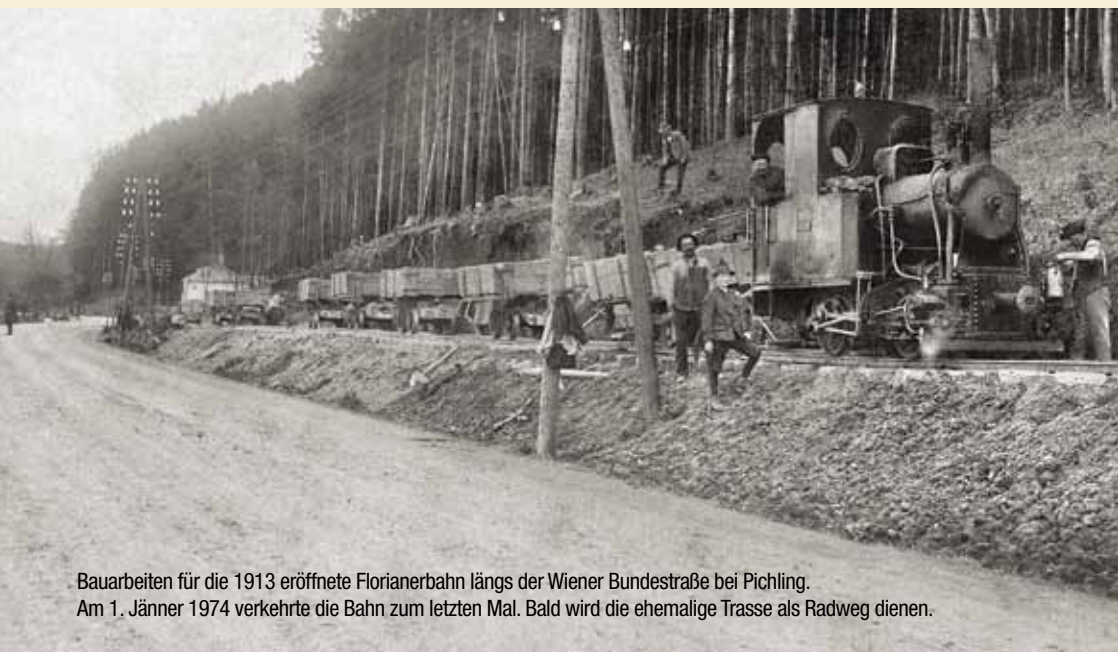
Bauarbeiten für die 1913 eröffnete Florianerbahn längs der Wiener Bundestraße bei Pichling. Am 1. Jänner 1974 verkehrte die Bahn zum letzten Mal. Bald wird die ehemalige Trasse als Radweg dienen.

Die Linie 13 soll vom Mühlkreisbahnhof über die Hafestraße und die Industriezeile sowie die Umfahrung Ebelsberg bis zum Pichlingersee geführt werden. Die Schnellbuslinie 14 soll vom Hafen zum Ennsfeld reichen und dabei etwa die Garnisonstraße und die Traundorferstraße befahren. Bis es so weit ist, müssen sich die Fahrgäste aber noch ein wenig gedulden: Denn bis die Buslinien in Betrieb gehen können, wird es voraussichtlich noch vier Jahre dauern.