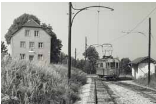
Das Gasthaus „Zur Lindenwirtin“ an der Haltestelle Ufer der Florianerbahn zwischen Ebelsberg und Pichling. Heinrich Drum besuchte es wegen der besonders gastfreundlichen Wirtin sehr gerne. Heute befindet sich in diesem Haus ein Bordell.