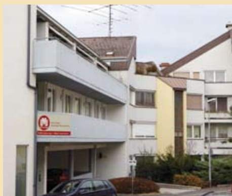
Das LML-Büro in Ebelsberg am Panholzerweg.

Nützen Sie unseren Gutschein für einen kostenlosen Versicherungs-Check und profitieren Sie von unserer Beratungskompetenz. Wir freuen uns, Sie demnächst begrüßen zu dürfen.