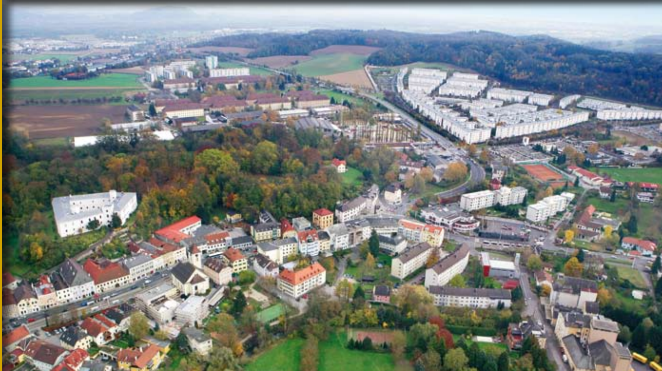
Mit 25 km 2 ist der Süden von Linz der größte Stadtteil. In Ebelsberg & Pichling leben heute mehr als 17.000 Menschen.

Wir freuen uns jederzeit über Veranstaltungshinweise. Kontaktieren Sie uns bitte unter 0732/320585 oder info@linz-sued.at