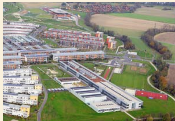
Schulzentrum im Linzer Süden: VS und AHS in der solarCity.

motivierend gestaltete Ausbildung werden auch immer wieder Schwerpunkte gesetzt – wie zum Beispiel ein Theaterprojekt im Rahmen von Linz 09 mit Vorführungen im Mai, Projekte zum Jahr der Naturwissenschaften, ein Sozialprojekt im Rahmen des Festivals der Regionen 09 mit dem Hartlauerhof und der Volksschule 52,.... Durch zusätzliche Angebote und Kurse wie Fußball, Volleyball, die Musikbande (=Chor&Orchester), Lernen Lernen, Computer- und Unternehmerführerschein, Informatik,...ist der Schulalltag sehr bunt. Auch der Elternverein ist sehr bemüht, in der Partnerschaft mit der Schule an der Weiterentwicklung mitzudenken und mitzuhelfen. Im sogenannten Psychosozialen Netzwerk wird versucht, möglichst rasch Probleme der jungen Menschen aufzugreifen und an der Lösung mitzuhelfen. Der Termin für die offizielle Schuleröffnung ist noch nicht fixiert, wohl aber