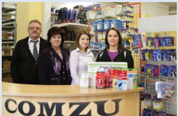
Das Comzu Team freut sich auf Ihren Besuch - als kleinen Bonus gibt es ab einem Einkaufswert von € 50,- ein Headset gratis! (bis 31.12.2008)

Seit 14 Jahren ist Comzu ein kompetenter Ansprechpartner in Sachen Computer-Verbrauchsmaterialien. Als ein in Pichling gegründeter Familienbetrieb sind wir aus Platzgründen in die Traundorferstraße übersiedelt, wo wir eines der größten Tinten- und Tonerlager in ganz Linz betreiben. Seit jeher sind wir bestrebt, unseren Kunden das beste Preis-Leistungsverhältnis anbieten zu können. Oftmals sind kompatible Druckerpatronen um ein Vielfaches billiger als das Original. Und das bei gleicher Ergiebigkeit! Wir beraten Sie gerne, welche Patrone zu Ihrem Gerät passt. Als Fachhandel führen wir natürlich sämtliche Marken.