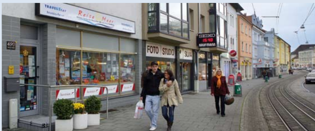
Direkt im Zentrum von Ebelsberg, Wiener Straße 490, macht das Büro ReiseMeer Ihre Urlaubsträume wahr.

Seit 2007 verschreibt sich „Reise-Meer“ einer qualitätsvollen und fachgerechten Urlaubsplanung für Menschen mit und ohne Handicap. Unser Team nimmt sich Zeit für seine Kunden und berücksichtigt die individuellen Bedürfnisse. Gemeinsam erstellen wir einen Anforderungskatalog und treffen eine Vorauswahl mit dem Ziel, Ihren Urlaub zum unvergesslichen und barrierefreien Erlebnis zu machen. Dass gutes Service schon bei bequemer Erreichbarkeit unseres Büros mitten in Ebelsberg anfängt, versteht sich von selbst. So ist es auch für Rollstuhlfahrer oder Menschen mit Gehbehinderung uneingeschränkt zugänglich. Als einziges Reisebüro im Süden von Linz dürfen wir Sie besonders jetzt einladen, dem nasskalten Wetter zu entfliehen. Wir helfen Ihnen gern bei der Auswahl und Planung Ihrer Traumreise.