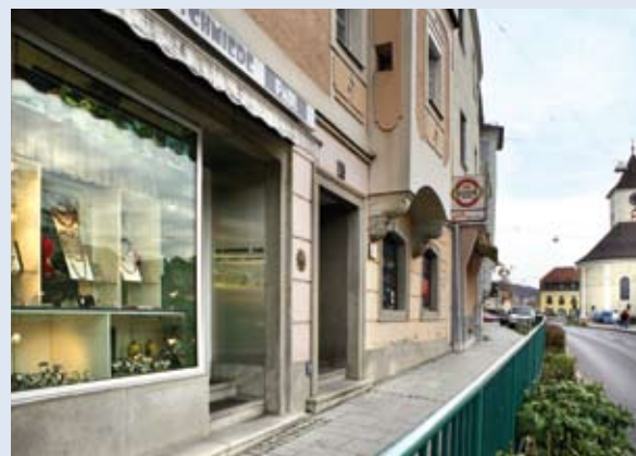
Feinste Handwerkskunst am Ebelsbergerer Fadingerplatz.