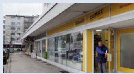
Besuchen Sie unseren Shop in der Traundorferstraße 14 und überzeugen Sie sich selbst von der breiten Produktpalette.

Seit 14 Jahren ist Comzu ein kompetenter Ansprechpartner in Sachen Computer-Verbrauchsmaterialien. Als ein in Pichling gegründeter Familienbetrieb sind wir aus Platzgründen in die Traundorferstraße übersiedelt, wo wir eines der größten Tinten- und Tonerlager in ganz Linz betreiben. Seit jeher sind wir bestrebt, unseren Kunden das beste Preis-Leistungsverhältnis anbieten zu können. Oftmals sind kompatible Druckerpatronen um ein Vielfaches billiger als das Original. Und das bei gleicher Ergiebigkeit! Wir beraten Sie gerne, welche Patrone zu Ihrem Gerät passt. Als Fachhandel führen wir natürlich sämtliche Marken.